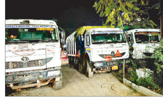
थाना परिसर में खड़ी जब्त वाहन।

खनिजों के अवैध उत्खनन, परिवहन और भण्डारण के मामले में खनिज विभाग ने कार्रवाई करते हुए 11 मार्च से 13 मार्च तक 5 हाइवा व 6 ट्रैक्टर ट्राली सहित 11 वाहन जब्त किए गए। यह कार्रवाई आगे भी जारी रहेगी। खनिज विभाग के अफसरों ने बताया कि कलेक्टर के निर्देशानुसार एवं उप संचालक के मार्गदर्शन में जिला बिलासपुर में खनिज विभाग द्वारा खनिजों के अवैध उत्खनन, परिवहन एवं भंडारण पर लगातार कार्रवाई की जा रही है। विभाग के अनुसार 11 मार्च से 13 मार्च तक तीन दिन खनिज अमला बिलासपुर द्वारा निरतु, लोफन्दी, कच्छार, लखनपुर, रतनपुर लमेर, लारिपारा घुटकू, निरतु संदरी, कोनी, बिरकोना, मोपका, चकरभाठा, दरीघाट, जयरामनगर मस्तूरी क्षेत्र की जाँच की गयी। जाँच के दौरान लारिपारा क्षेत्र से खनिज रेत का अवैध