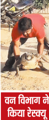
वन विभाग ने किया रेस्क्यू

जाल असामान्य रूप से भारी हो गया। मछुओं ने जाल को खींचकर बाहर निकाला तो उसमें एक विशाल मगरमच्छ फंसा हुआ दिखा। मगरमच्छ की लंबाई 7 से 8 फीट की थी। अचानक मगरमच्छ को देखकर मछुआरे और आसपास मौजूद लोग घबरा गए। भीड़ बढ़ते देख स्थानीय लोगों ने तत्काल इसकी सूचना वन विभाग की टीम को दी। सूचना मिलते ही वन विभाग की टीम ने मौके पर पहुंचकर सावधानीपूर्वक रेस्क्यू कर मगरमच्छ को अपने कब्जे में लिया। टीम ने सुरक्षा के साथ मगरमच्छ को जाल से बाहर निकालकर सुरक्षित स्थान पर ले जाया गया। विभागीय अधिकारियों के अनुसार मगरमच्छ को सुरक्षित स्थान पर ले जाकर उसके स्वास्थ्य की जांच करने के बाद उपयुक्त प्राकृतिक आवास में छोड़ा जाएगा।