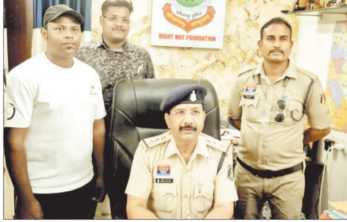
उन्होंने आटो चालक को आगरा की 3 पास 20 हजार रूपए नकद और 50 हजार से अधिक की राशि मोबाइल वालेट में होने

मामला सिविल लाइन थाना क्षेत्र के उसलापुर इलाके का है। बताया जा रहा है कि गुरुनानक चौक से 3 नाबालिग लड़कियां स्कूल ड्रेस में आटो पर बैठीं और रेलवे स्टेशन जाने की बात कहने लगीं। आटो चालक के अनुसार आटो में ही नाबालिगों ने पहले बुर्का पहना और रेलवे स्टेशन में रोकने के लिए कहा। इस दौरान