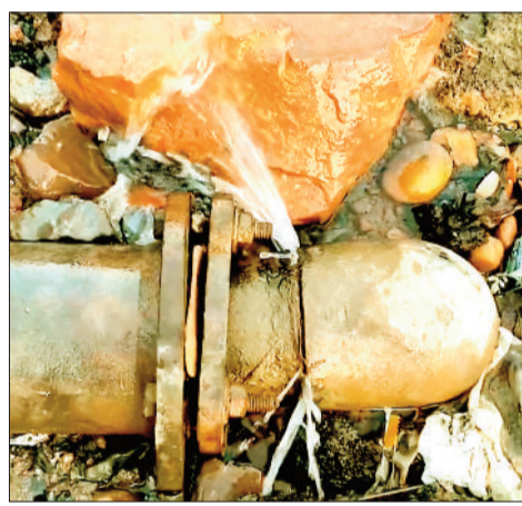
हेमूनगर स्थित महापौर के घर के सामने पाइप लाइन फूटी।

लिंगियाडीह में भी इन दिनों पानी की समस्या बनी हुई है। लो प्रेशर की समस्या है। मोहल्ले के कई घरों में नल से नियमित पानी की आपूर्ति नहीं हो पा रही है, जिसके कारण लोगों को टुरत पाइपलाइन की जाँच कराकर लोगों को साफ पानी उपलब्ध कराना चाहिए। अधिकारियों का कहना है कि जहाँ-जहाँ समस्या सामने आ रही है, वहाँ पाइपलाइन की जाँच और मरम्मत का काम कराया जा रहा है। प्रभावित क्षेत्रों में टैंकरों के जरिए वैकल्पिक व्यवस्था करने के निर्देश दिए हैं। फिलहाल अधिक परेशानी नहीं है। जल विभाग की अगुआई में टीम बनाई गई है।