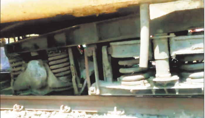
हरिभूमि न्यूज || बिलासपुर

शहडोल से नागपुर की ओर जा रही एक्सप्रेस के पहिए अचानक बेपटरी होने से अफरा-तफरी मच गई। इस दौरान अचानक कोच के पटरी से उतरने के कारण डरे सहमे यात्री इमरजेंसी खिड़की और दरवाजे से अपनी जान बचाने के लिए कूद गए। वहीं घटना की जानकारी मिलते ही संबंधित विभाग की टीम ने मौके पर पहुंचकर बेपटरी हुए कोच को पटरी पर लाकर रवाना कर दिया। दूसरी ओर घटना की गंभीरता को देखते हुए उच्चाधिकारियों ने जांच टीम बना दी है, जिसकी रिपोर्ट के बाद आगे की कार्रवाई करने का निर्णय