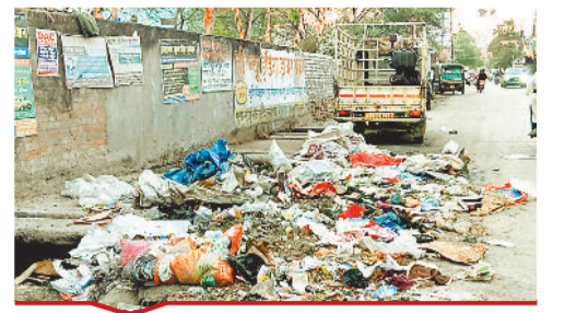
कुम्हारपारा की सड़क पर फेला कचरा, सफाई नहीं होने से लोग बदबू से परेशान हो रहे हैं।

[बिल्हा | मस्तूरी | तखतपुर | मुंगेली | कोटा | लोरमी | सरगांव | पेंड़ा | बेलतरा | रतनपुर | पथरिया]