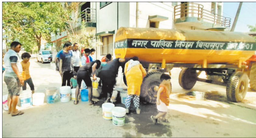
दीनदयाल कालोनी में टैंकर से पानी लेने के लिए जद्दोजहद करते लोग।

न्यायधानी बिलासपुर में गर्मी ने अभी पूरी तरह दस्तक भी नहीं दी है, लेकिन शहर की प्यास बुझाने वाले इंतजाम दम तोड़ते नजर आ रहे हैं। नगर निगम क्षेत्र के पुराने मोहल्लों से लेकर निगम में शामिल हुए नए वार्डों तक, इन दिनों पानी की भारी किल्लत और दूषित सप्लाई ने लोगों का जीना मुश्किल कर दिया है। मंगला, कुदूदण्ड, लिंगियाडीह में मोटर पंप खराब हो रहे हैं।