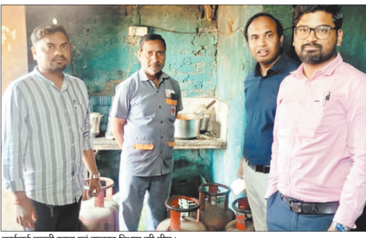
कार्रवाई करती खाद्य एवं राजस्व विभाग की टीम।