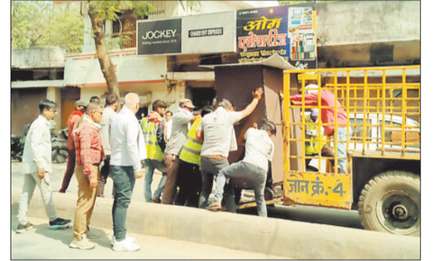
अवैध कब्जे पर कार्रवाई करता नगर निगम का अमला।

एएन6083 के चालक ने दुर्घटना को अंजाम दे दिया। हादसा इतना भयंकर था कि कार दो बार पलटने के बाद सीधे गड्ढे में जा गिरी और पटल गई। अचानक हुई इस दुर्घटना से आसपास अफरा तफरी मच गई। स्थानीय लोगों ने कार चालक को जैसे तेसे बाहर निकाला और पुलिस को इसकी सूचना दी है। सूचना मिलने पर मोपका पुलिस मौके पर पहुंची और चालक को इलाज के लिए अस्पताल ले जाया गया। प्रत्यक्षदर्शियों के मुताबिक चालक शराब के नशे में था। बताया जा रहा है कि कई महीनों से सड़क पर गड्ढा बना हुआ है लेकिन बार-बार शिकायत के बाद भी प्रशासन की ओर से सड़क को मरम्मत नहीं कराई गई है।